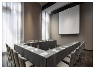
Meeting Room I + II