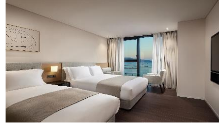
스탠다드 패밀리 트윈

신라호텔 수준의 고급 침구와 어메니티, 모던하고 감각적인 디자인으로 휴식의 차원을 한 단계 더 업그레이드 합니다.